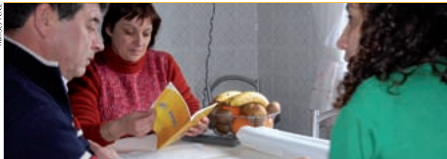
Fogares Verdes xa pasou por 50 vivendas do concello de Santiago.

Durante o 2008, 50 domicilios de Santiago de Compostela participaron no programa de educación ambiental Fogares verdes. Este programa de acompañamento que dá continuidade aos proxectos de compostaxe caseira vén demostrar que cunhas doses de reflexión, outro pouco de vontade e algúns cambios de hábitos pódese aforrar auga e enerxía no día a día, no noso fogar. A experiencia desenvolveuse tamén nos concellos de Porriño e Ames.