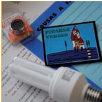
Adega entrega a todos os participantes un "quit de aforro".

tes un "quit de aforro" composto por: unha bolsa de tea, unha lámpada de baixo consumo, un perlizador para a billa, un redutor de caudal para a ducha, o caderno de "Fogares Verdes", a guía práctica de aforro enerxético do INEGA e dúas tarxetas desconto dun par de ferreterías da cidade.