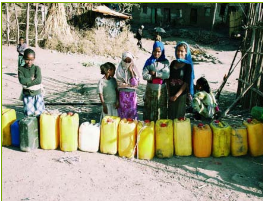
As mulleres de Mersa (Etiopía) camiñan 4 ou 5 horas diarias para obter auga