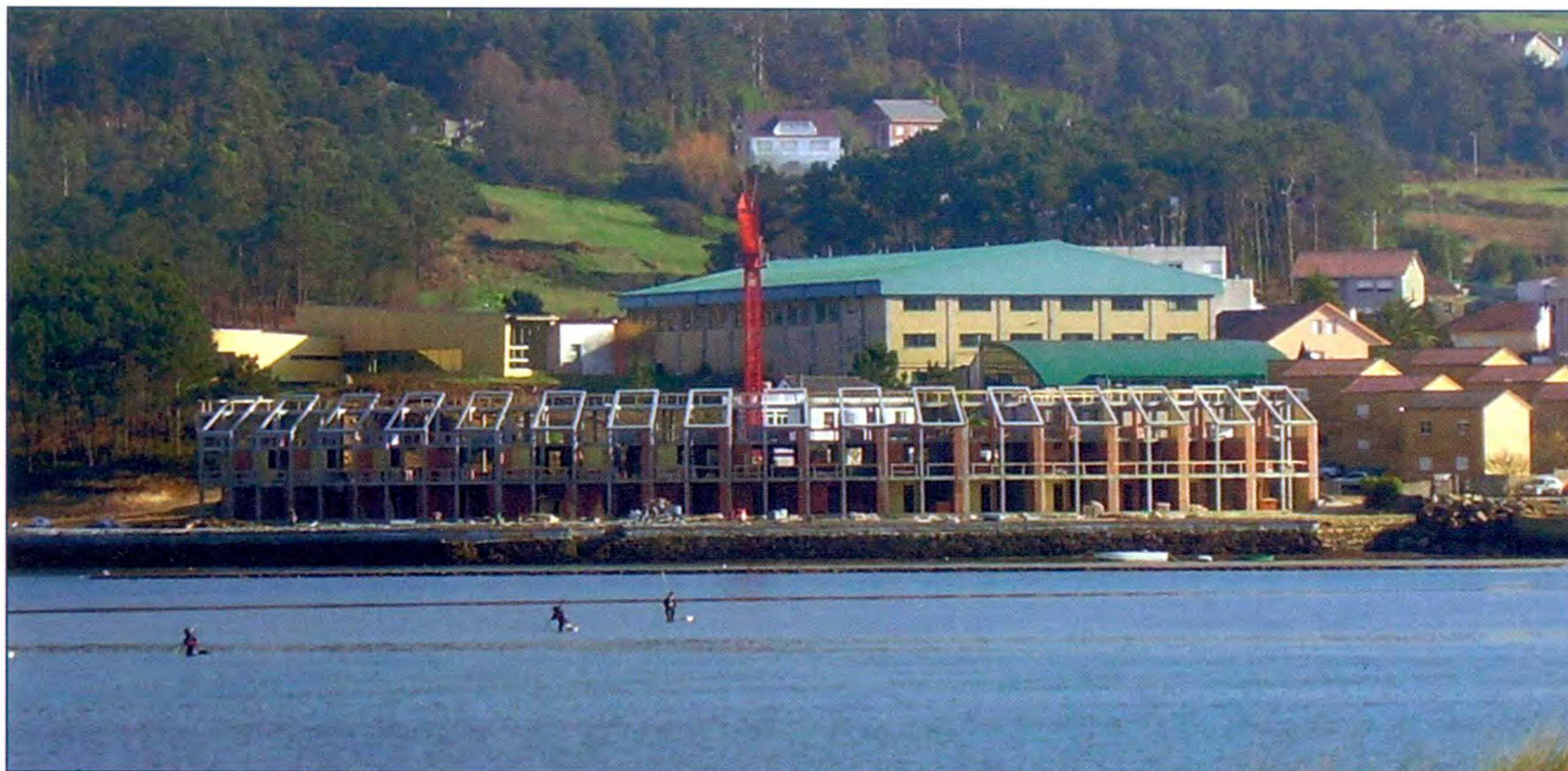
Hotel en construción ao pé do mar, no esteiro do Anllóns