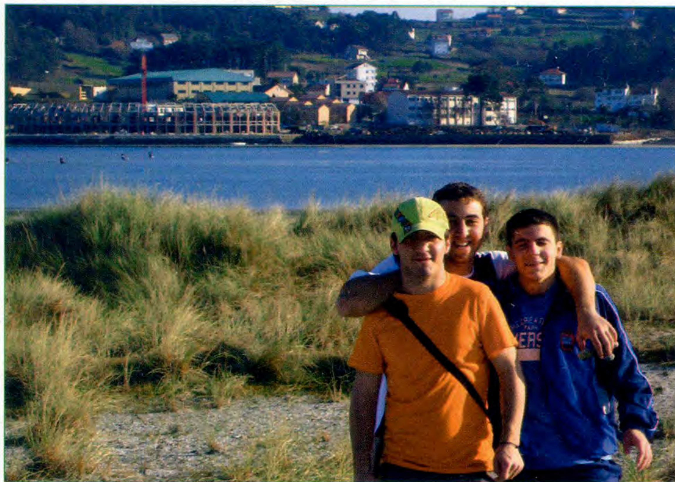
Os autores deste artigo, ao pé da ría