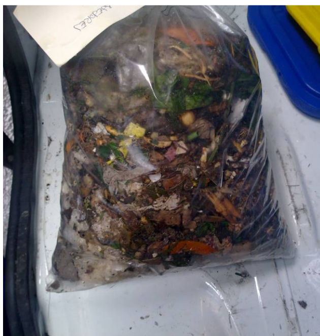
Figura 7. Muestra de RSU para enviar al laboratorio.