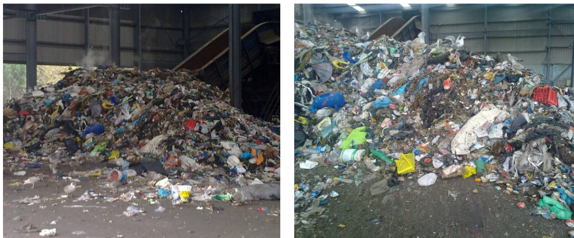
Figura 6. Acopios de RSU a su recepción en el vertedero.