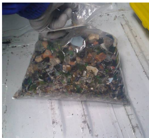
Figura 5. Contenedor de recepción del residuo desde las mesas densimétricas y muestra preparada para enviar al laboratorio.