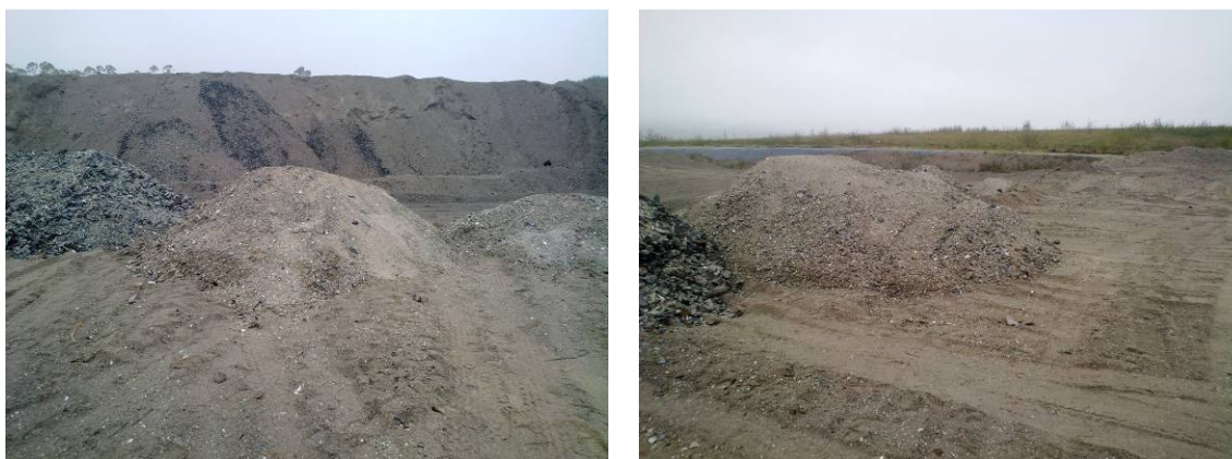
Figura 3. Acopios de escorias a su recepción en el vertedero.