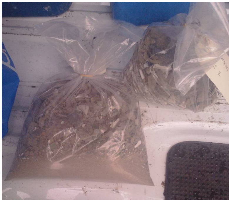
Figura 4. Muestra de escorias.