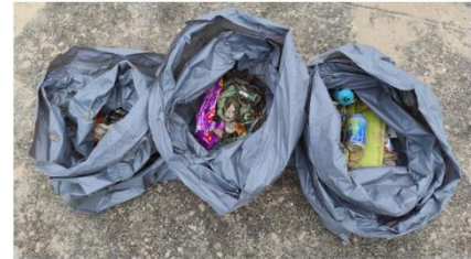
Lixo recollido pola rapazada de Muros

Durante a pasada fin de semana (14 e 15 de outubro), máis de 30 entidades e máis de 1.000 persoas de toda a xeografía galega sumaron os seus esforzos ao longo do noso litoral para limpar as praias e denunciar a problemática ambiental do lixo mariño. Fixérono ao abeiro de undécima edición da Limpeza Simultánea de Praias de ADEGA. Retirouse en total unha tonelada de refugallo dos nosos areais. Colaboraron as rapazas e rapaces do CEIP de Portosín (días antes da limpeza simultánea desta finde) e tamén da Escola de Educación Infantil de Muros.