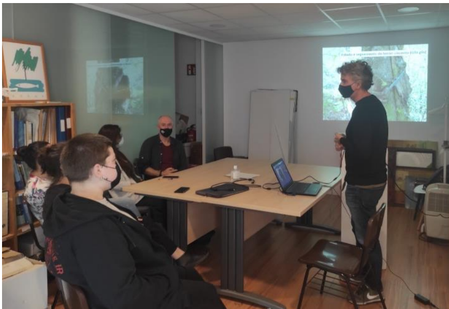
Imaxe do curso de formación